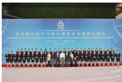
图 7 学院学生参加亚信峰会会务

生社会交际能力，展示学院形象，提升学院影响力。2014 年 5 月 21 日，亚洲相互协作与信任措施会议第四次峰会在上海举行，学院 44 名空中乘务专业学生参