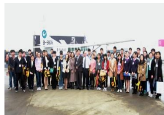
图 5 公务机认知主题活动

2014 亚洲公务航空会议和展览会 (ABACE2014) 于 4 月 15~17 日在上海举行。42 名学生受邀参加了此次“大学生公务机认知主题日”活动。学院组织学生参观东航工程技术公司发动机车间、上海飞机制造有限公司、