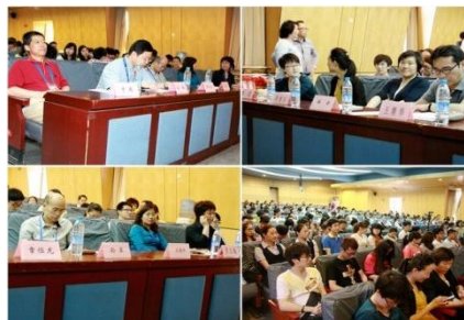
图 2 学院外语节