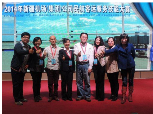
图 14 学院支持新疆机场集团开展技能大赛

（集团）公司、上海机场贵宾服务公司、辽宁机场（集团）公司、内蒙古机场（集团）公司等单位组织机场大赛，派出专业团队对比赛场地设计、试题编制、实操情景表演