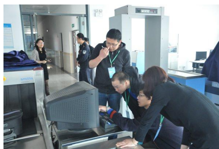
图 13 为公安民警提供爆测培训

学院适应民航业和上海地方经济发展需求，各类成人培训规模不断扩大。2014年，成人学历教育专本科在册学生455人，各类培训30766人/天。2014年华东管理局把航空气象测报、航空通讯导