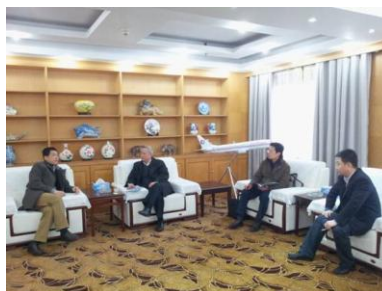
图9 学院领导走访江西用人企业

2014年，学院先后邀请中国商用飞机有限责任公司、春秋航空、吉祥航空、厦门航空等优质企业和社会公益组织进校园，为学生带来丰富多彩的就业宣讲，开阔学生眼界，帮助学生精准定位就业职