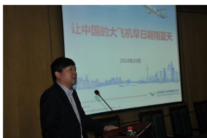
图8 中国商用飞机有限责任公司宣讲会

学院2012年首次招生，2015年首批学生将走向就业岗位，在校期间学院通过“入学阶段就业指导讲座”、“实习前就业指导讲座”，让学生明确学院的就业推荐流程、自己的职业定位和参加面试的技巧。