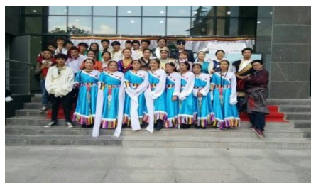
图 1 学院藏文化节

活动中促进校园和谐。学院学生处、团委、思政教研室共同发起学院藏文化展示月活动，由藏族学生组织策划，学生们用图片、视频、服饰、藏文字书法展示、藏文字书写班、歌咏比赛、藏文化专题讲座等多种形式展示藏文化魅力，