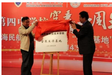
图 12 生源基地揭牌

学院成立以来，按照“立足华东，面向全国”的原则，根据民航行业发展特点，加大宣传力度。2014 年，在重点保证华东地区生源的基础上，特别向高等教育欠发达且生源数量相对较多、升学压力较大的中西部地区实施倾斜，西藏、新疆等少数民族聚集区的招生规模也在扩大。2014 年面向 31 个省区招生 2400 人，实际招收 2132 人，报到率达 91.6%，专业拓展至 12 个民航类专业。